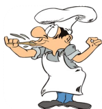
Técnico de Restauração: Cozinha/Pastelaria