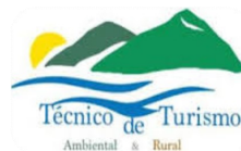
Técnico de Turismo Ambiental e Rural